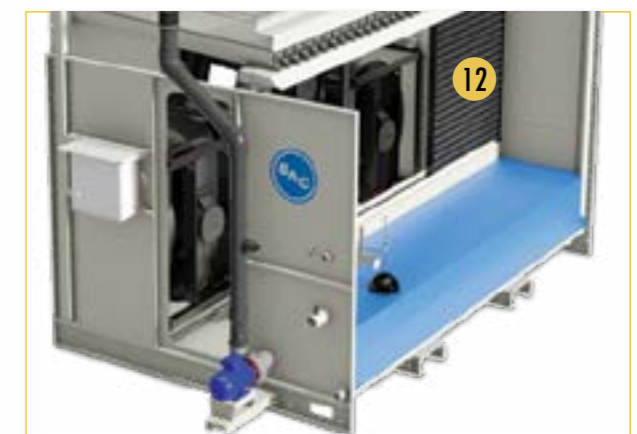
Sólo para los modelos de la generación anterior PLC 12. Filtros de acción múltiple