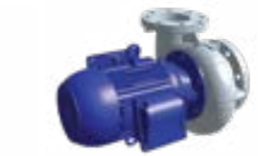
Bomba de pulverización con voluta