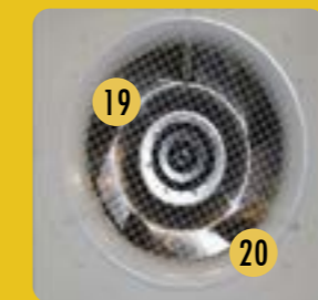
Sistema de transmisión de ventiladores radiales - Detalle

Las cantidades pueden variar en función del modelo del equipo.