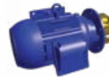
Bomba de pulverización sin voluta